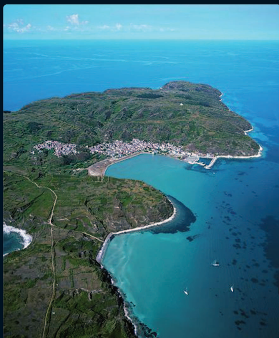
Il porto e la rada