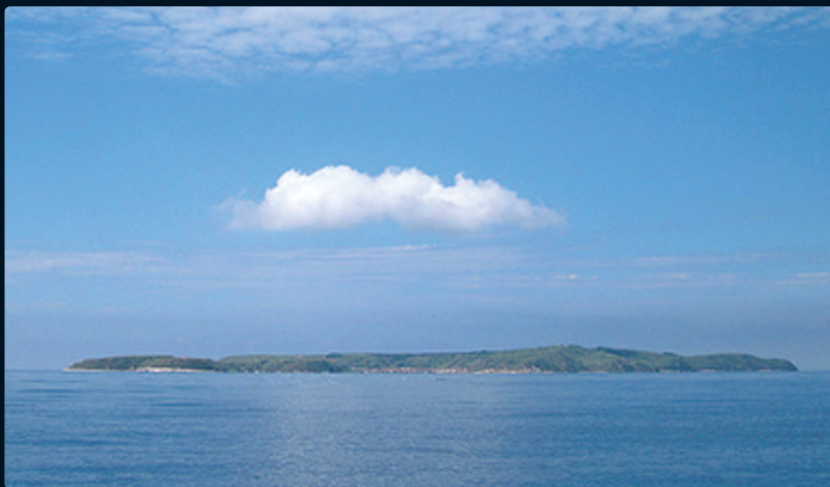
Sansego vista da Levante