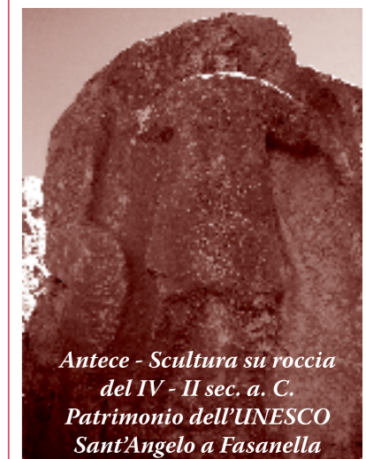
Antece - Scultura su roccia del IV - II sec. a. C. Patrimonio dell'UNESCO Sant'Angelo a Fasanello