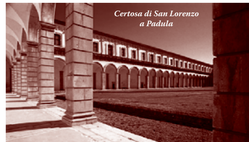
Certosa di San Lorenzo a Padula

Ci giunge, inviata dagli amici del CAI Sezione di Fiume, una bella descrizione della settimana alpina che ha riunito, nei primi giorni di giugno, un nutrito gruppo di soci, fiumani e non, nella tradizionale escursione di inizio stagione. Nel presentarla, cogliamo l'occasione per augurare ai componenti della sezione alpinistica fiumana, oltre all'impegno sempre vivo che la caratterizza, un cordiale "buon lavoro" per portare sempre avanti il nome dell'amata città.